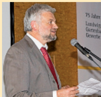
Wolfgang Reimer , Ministerialdirektor im Ministerium für Ländlichen Raum und Verbraucherschutz.