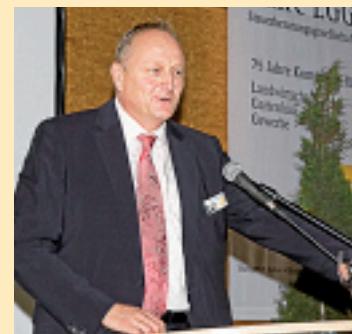
Joachim Rukwied , Präsident des Landesbauernverbandes in Baden-Württemberg.